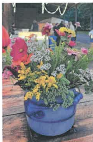
Sommerflimmern 2025 auf Hof Middendorf in Bissendorf

Ferner bitten wir um die Genehmigung zum vorzeitigen Maßnahmebeginn für 2026. Uns ist bewusst, dass damit keinerlei Finanzierungsverpflichtung des Förderers verbunden ist und dass das finanzielle Risiko auf Antragstellerseite bleibt.