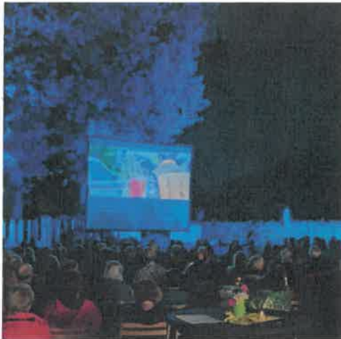
Sommerflimmern 2025 auf Hof Thünker in Wallenhorst